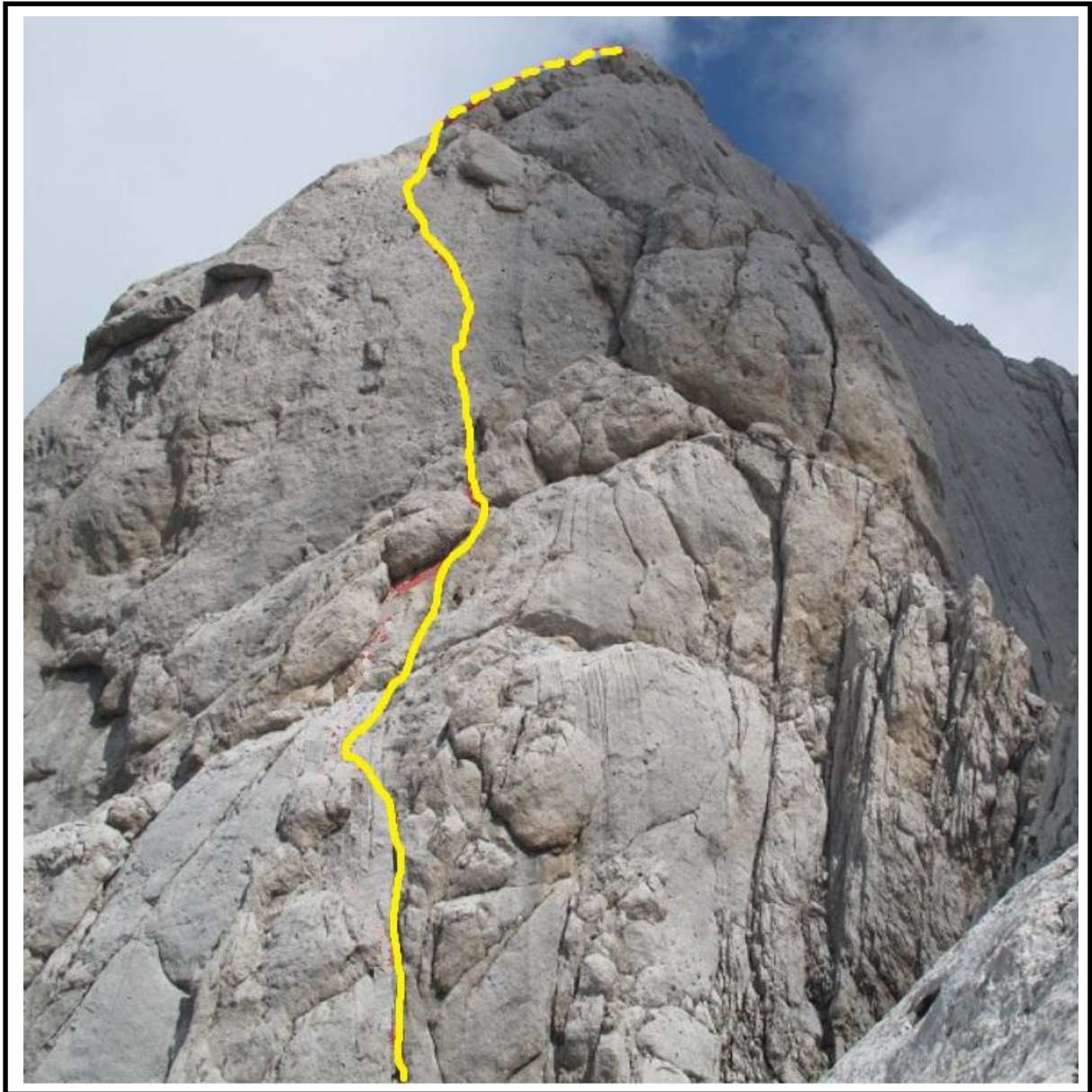
La parete ovest della I Spalla con il tracciato di "Suerte y veras" (manca metà del primo tiro)